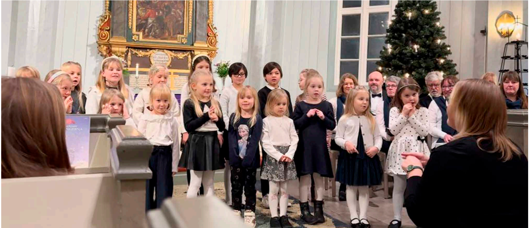
Församlingens barnkör har drygt tjugo sångare .

Lokalsidorna för de svenska församlingarna i Korsholm utkommer i varje nummer av Kyrkpressen. Redaktör: Johan Sandberg, johan.sandberg@kyrkpressen.fi, tfn 040 831 3599. Dessa sidor görs i samarbete med församlingarna och materialet är beställt av dem.