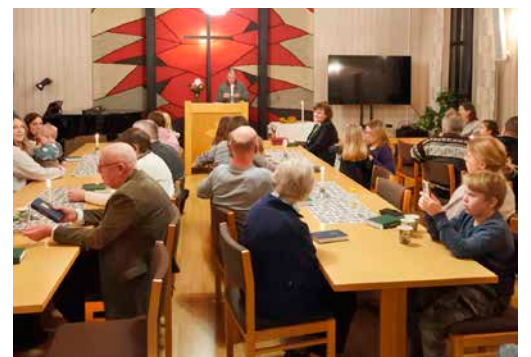
Middagen avslutas med gudstjänst.

Församlingshemmet är nu vattenskadat och golvet ska rivs upp, torka och läggas på nytt. I februari hade det arbetet ännu inte påbörjats.