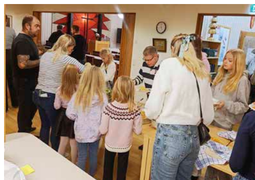
Replotborna låter sig väl smaka.