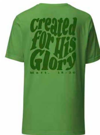
Skjortan är inspirerad av Romarbrevet 11:36.

»Jag vill inspirera andra till att också hitta Jesus.«