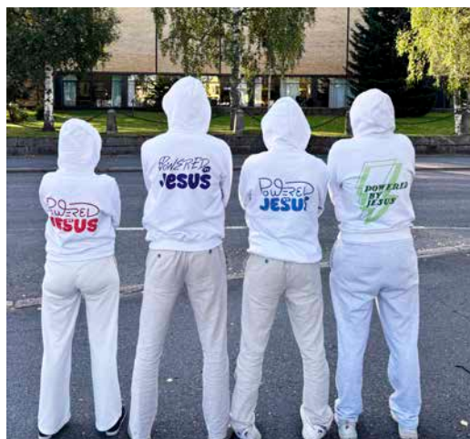
Genom texten påminner sig ungdomarna själva och andra om att de tar sig genom vardagen genom Jesu kraft.