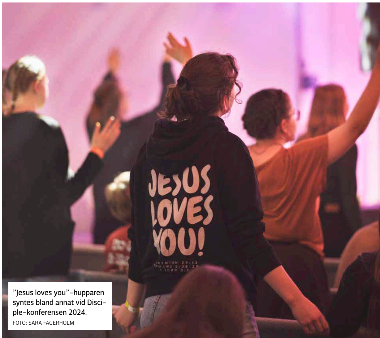
"Jesus loves you"-huppaparen syntes bland annat vid Disciple-konferensen 2024.