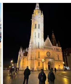
Här står tre av våra korister utanför Mattiaskyrkan där vi sjöng Mozarts Requiem.