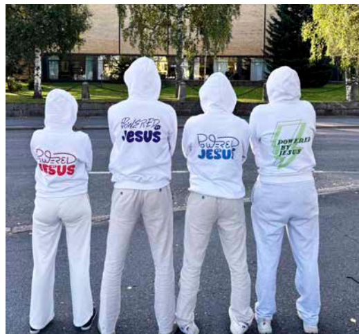
Genom texten påminner sig ungdomarna själva och andra om att de tar sig genom vardagen genom Jesu kraft.