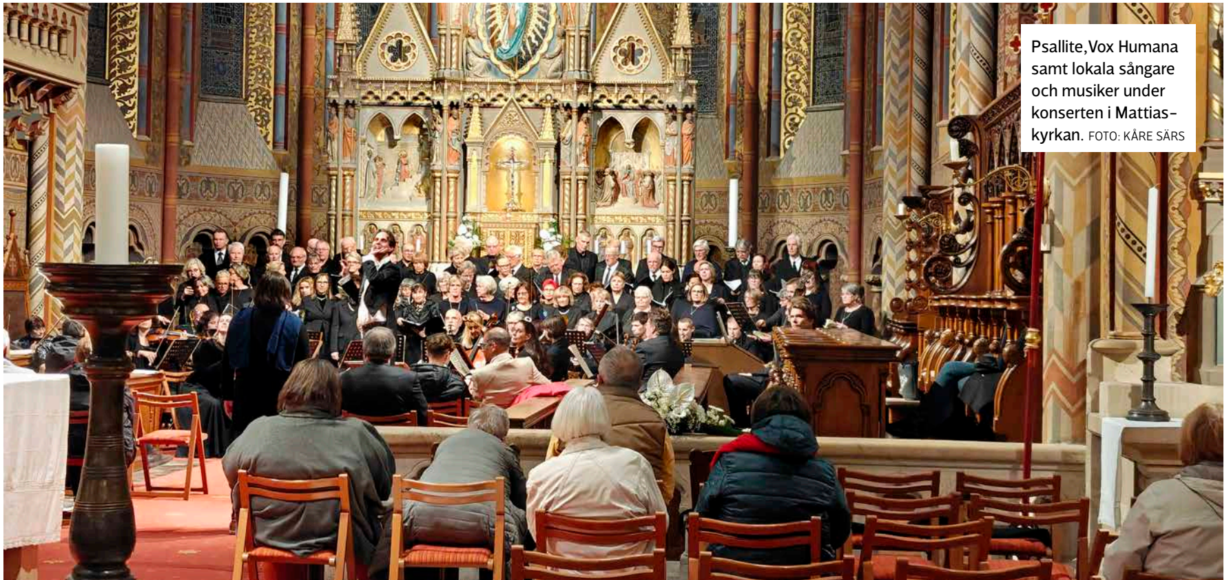
Psallite, Vox Humana samt lokala sångare och musiker under konserten i Mattiaskyrkan.