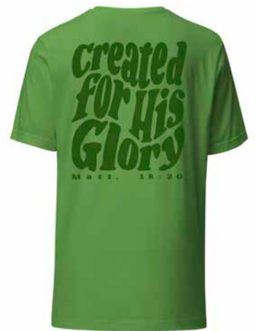
Skjortan är inspirerad av Romarbrevet 11:36.

»Jag vill inspirera andra till att också hitta Jesus.«