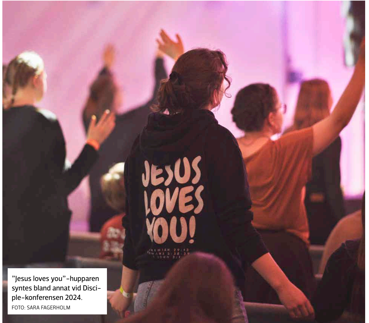
"Jesus loves you"-huppen syntes bland annat vid Disciple-konferensen 2024.