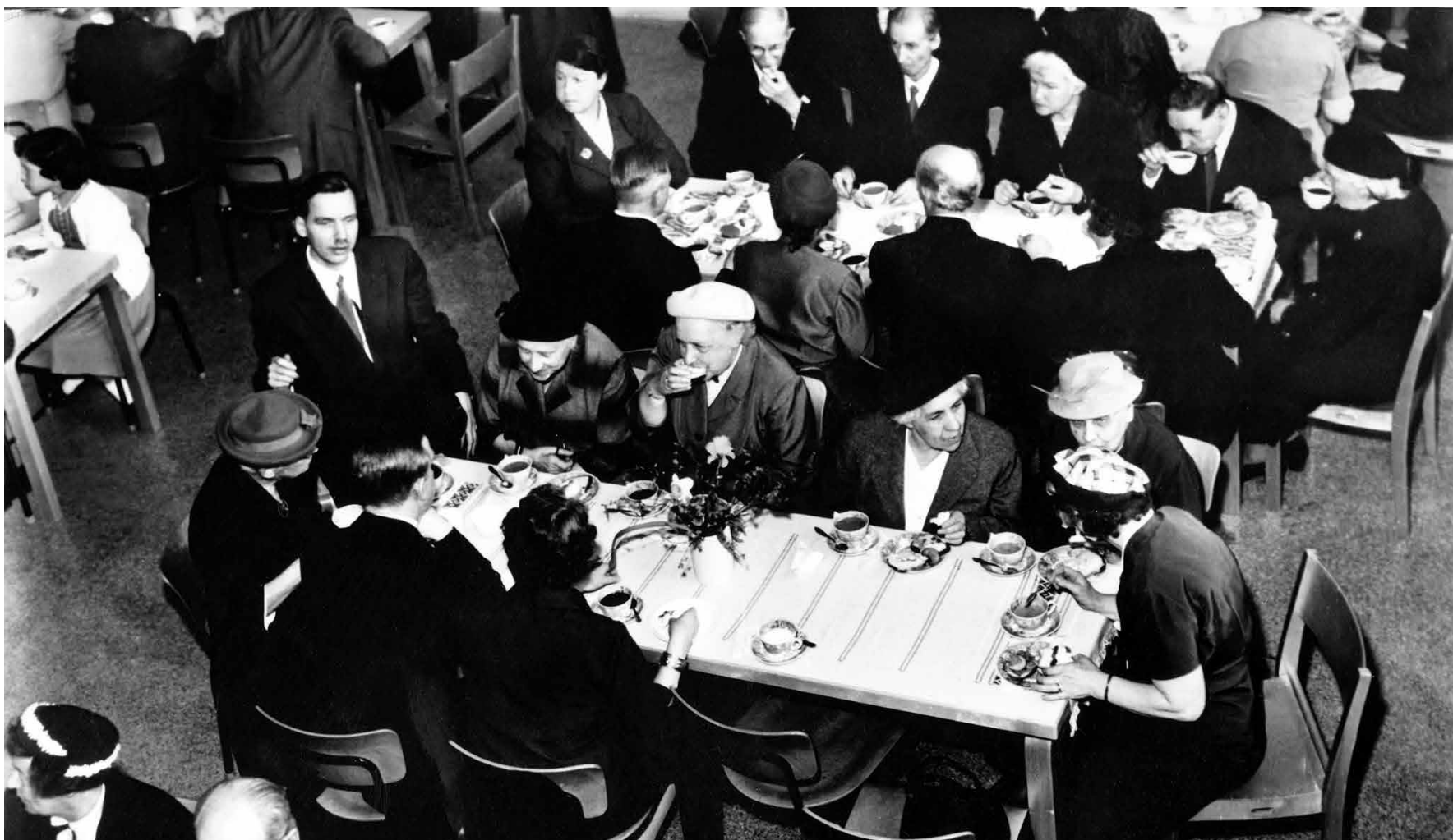
Brändöborna samlades till gemensam gudstjänst och kyrkkaffe när Brändö införlivades med Helsingfors på 40-talet.