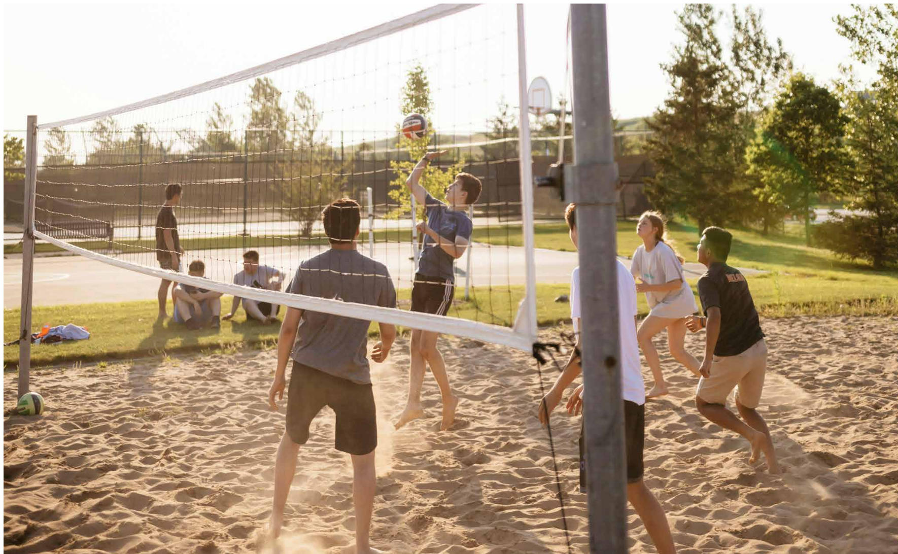
Också dagskriftskolan möjliggör aktiviteter och gemenskap.